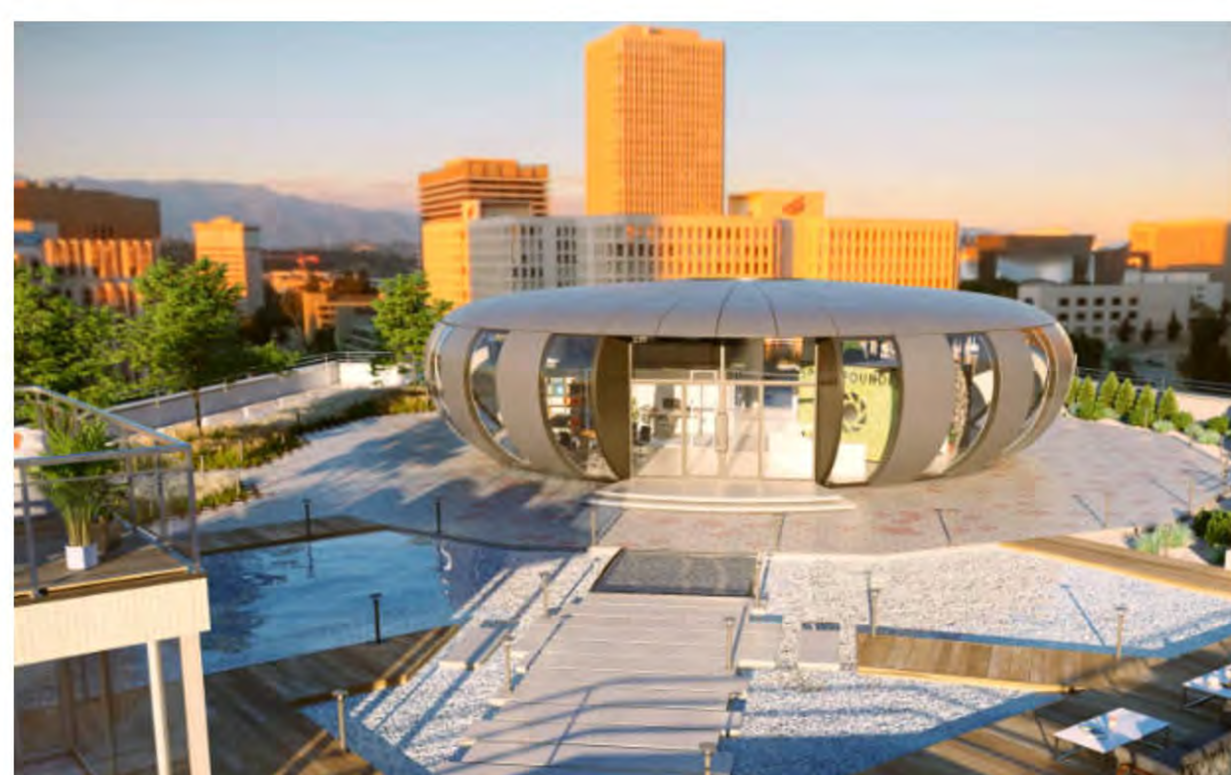
Wohnraum in neuen Dimensionen und auf dem anderen Kontinent bereits Realität: ein Haus auf dem Haus! Um Genehmigungen und Statik-Check kümmern sich die Space Founder-Ingenieure, wer sein Haus auf dem Haus wünscht!